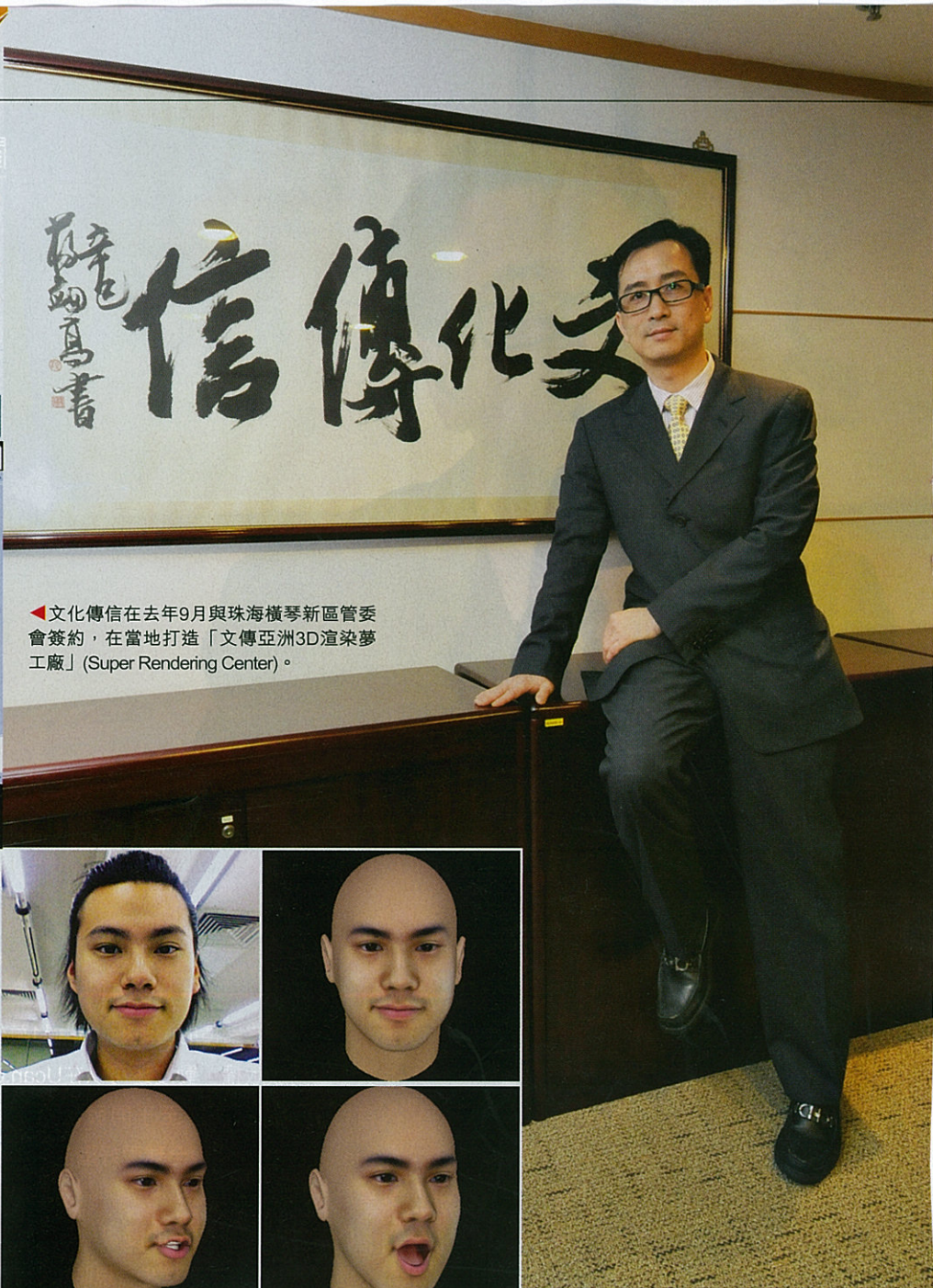
◀文化傳信在去年9月與珠海橫琴新區管委會簽約，在當地打造「文傳亞洲3D渲染夢工廠」(Super Rendering Center)。

就記者現場所見，用家在電腦上可先選定角色，然後可以調較表情、膚色、行路、動作甚至乎對話及擁抱等指令，然後再選擇合適場景，一段三十秒的短片就此「誕生」，最特別的是，用家如果不想用既定的漫畫人物，可以選擇將自己的樣子先行拍照，然後再進行3D化（如右方四格圖），「你」便可以第一身的角色「進入」動漫區之中，投入感非常豐富！