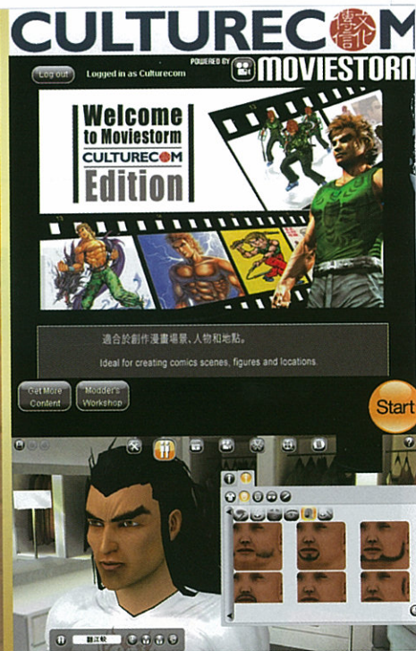
▲ Ucan.com會員在自動動畫系統上，不消多久，便可免費製成動畫短片，同時透過動漫社交平台自動搜尋系統，迅速能為個人找到數十萬計甚至數千萬的動漫社群。