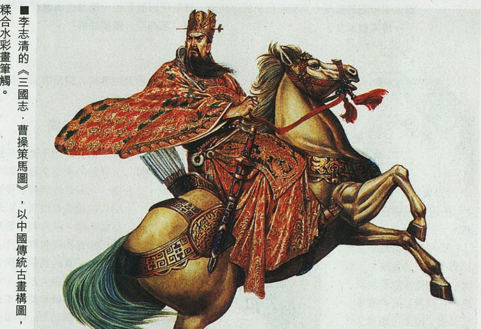
李志清的《三國志·曹操策馬圖》，以中國傳統古畫構圖，綜合水彩畫筆觸。

系列：中華英雄 期數：112 出版日期：1987年9月22日 作者：馬榮成 作品：火鳥（三） 此圖是馬榮成喜歡的作品之一，透過色調冷暖對比，烘托出主體人物，手法寫實細緻。