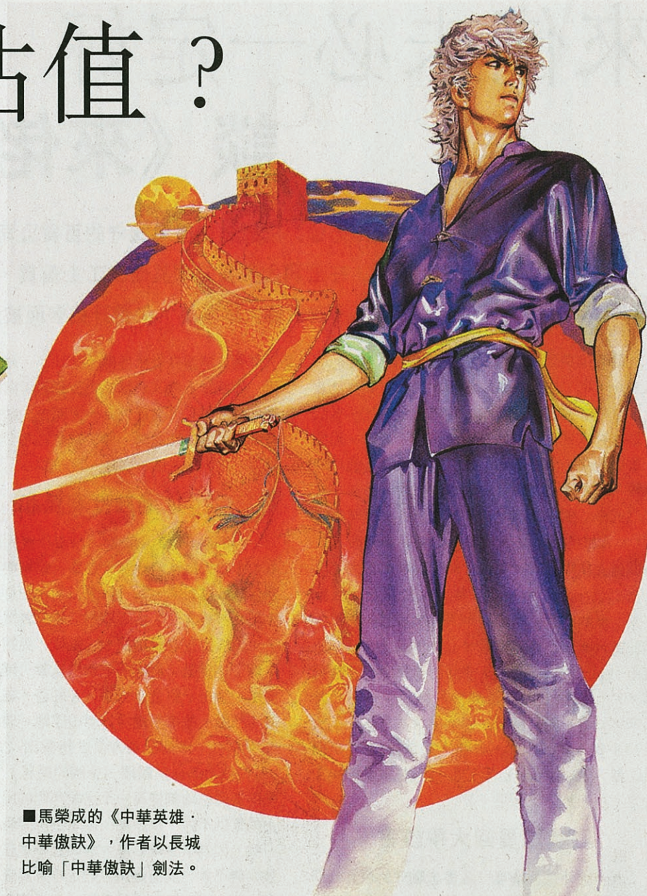
馬榮成的《中華英雄·中華傲訣》，作者以長城比喻「中華傲訣」劍法。

從前，香港漫畫製作，多以「作坊模式」經營。一個系列會有一個主筆，一個主筆會有多個助手。主筆專責繪畫人物等重要部分，助手則幫忙做背景、物件或林林總總的特效（不僅電影有特效，漫畫亦有）。叮嚀每次拿出法寶，四圍便「閃閃生光」。這個那個拼湊在一起，加上框框、文字等功夫，便成為漫畫。